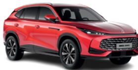
Czerwony „Diamond Red” (trójwarstwowy)