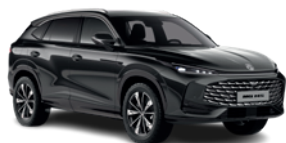
Czarny „Pebble Black” (metalik)