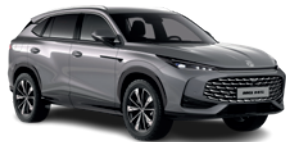
Szary „Hampstead Grey” (metalik)

Wybierz wariant wyposażenia: Excite, Exclusive, i przyciągaj spojrzenia, gdziekolwiek pojedziesz.