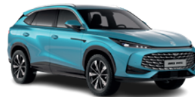
Niebieski „Arctic Blue” (standard)