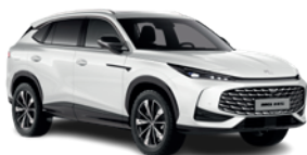
Biały „Pearl White” (perłowy)

* Lakiery trójwarstwowe, metaliczny i perłowy dostępne za dodatkową opłatą.