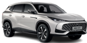
Srebrny „Sterling Silver” (metalik)