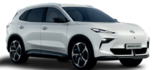
Biały „Dover White” (standard)