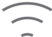
Aplikacja MG iSMART

Płynna jazda, inteligentna konstrukcja, niskie koszty eksploatacji, energetyzujący wygląd – wszystko to zapewnia niesamowite doznania.