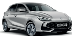
SREBRNY „COSMIC SILVER” (metalik)