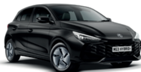
CZARNY „PEBBLE BLACK” (metalik)