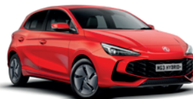
CZERWONY „DIAMOND RED” (trójwarstwowy)