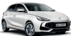
BIAŁY „DOVER WHITE” (standard)