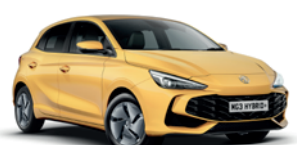
ŻÓŁTY „PASTEL YELLOW” (standard)

* Lakier trójwarstwowy i metaliczny dostępne za dodatkową opłatą.