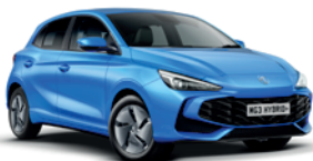
NIEBIESKI „COMO BLUE” (metalik)

MG3 Hybrid+ nie tylko sprawi, że poczujesz się dobrze, ale także że będziesz dobrze w nim wyglądać dzięki możliwości wyboru spośród siedmiu wyjątkowych, intrygujących kolorów – z opcjami standardowymi, metalicznymi i trójwarstwowymi. Przygotuj się na to, że będziesz przyciągać uwagę.