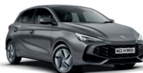
SZARY „HAMPSTEAD GREY” (metalik)