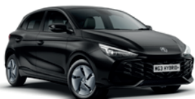
CZARNY „PEBBLE BLACK” (metalik)