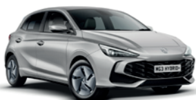
SREBRNY „COSMIC SILVER” (metalik)