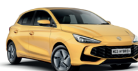
ŻÓŁTY „PASTEL YELLOW” (standard)

* Lakiery trójwarstwowe i metaliczne dostępne za dodatkową opłatą.